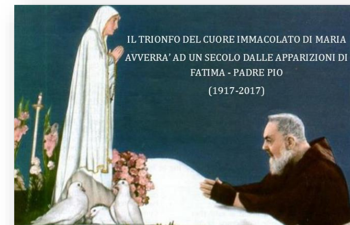
IL TRIONFO DEL CUORE IMMACOLATO DI MARIA AVVERRA' AD UN SECOLO DALLE APPARIZIONI DI FATIMA - PADRE PIO (1917-2017)

Non ci sarà la santa Messa in Cattedrale