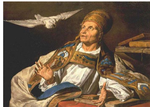
Matthias Stom, S. Gregorio Magno, XVII sec., Öffentliche Kunstsammlung, Bâle